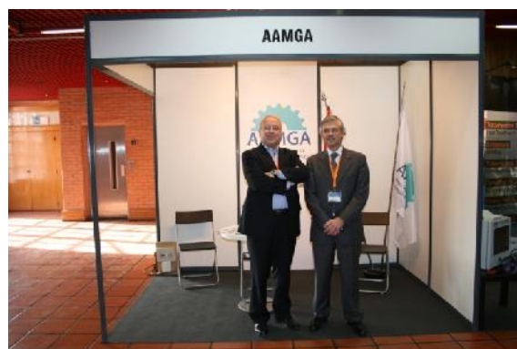
AAMGA – Associação Angolana de Manutenção e Gestão de Activos