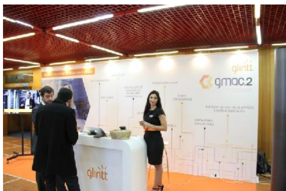
GLINTT – Patrocinador PLATINA