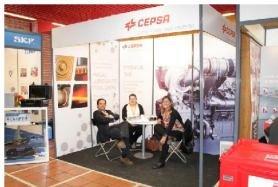
CEPSA-TOTAL– Patrocinador OURO