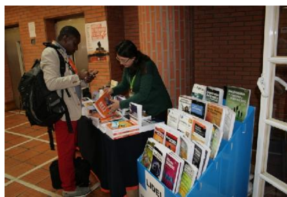
LIDEL - SOCODANTE