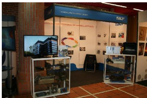
SKF– Patrocinador OURO