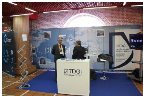
DTDTGI– Patrocinador OURO