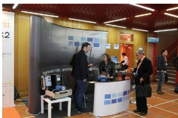
WEG– Patrocinador OURO